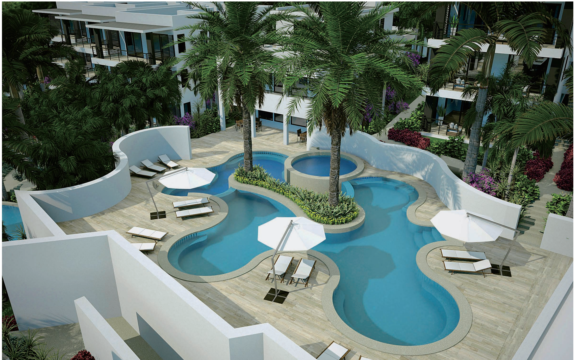
主游泳池/Main Swimming Pool